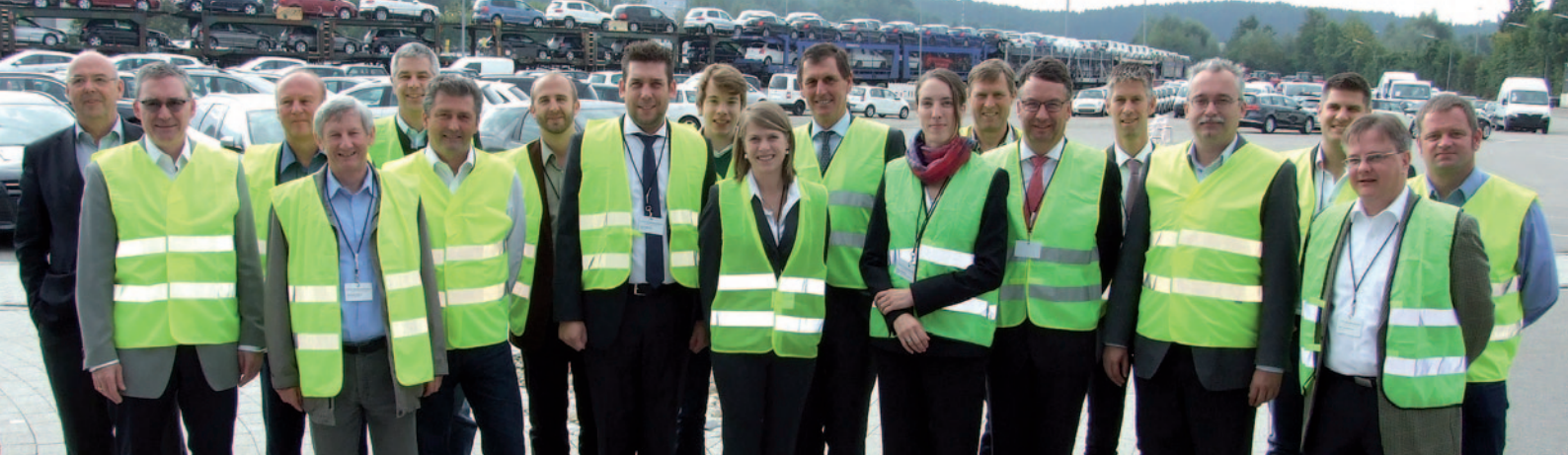
Treffen der ERFA Gruppe I bei ARS Altmann